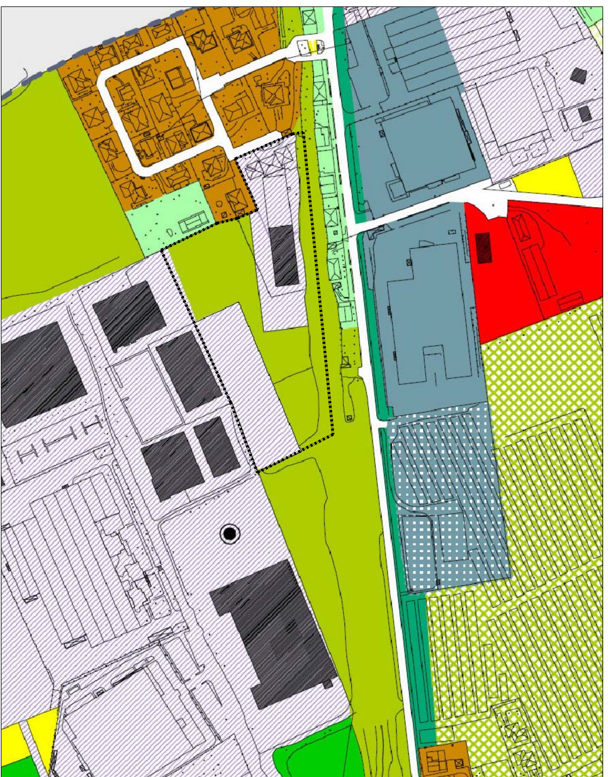
VARIANTE Estratto T3_quadro di riferimento - scala 1:2000