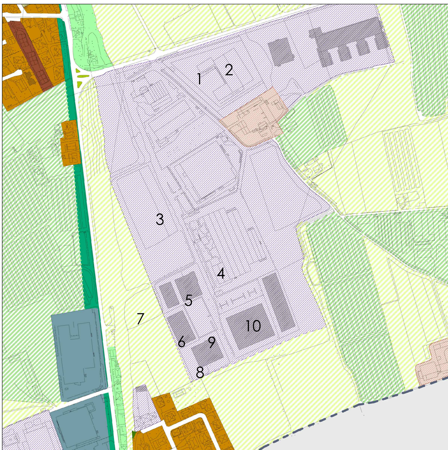
Mappa disposizione di tipologie prefabbricati