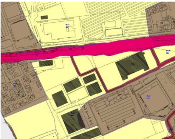
STATO DI FATTO Estratto T6_assetto idrogeologico