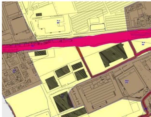
VARIANTE Estratto T6_assetto idrogeologico