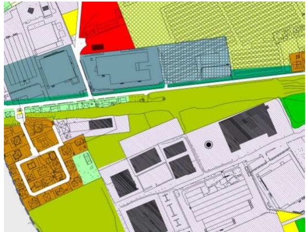
VARIANTE Estratto T3_quadro di riferimento