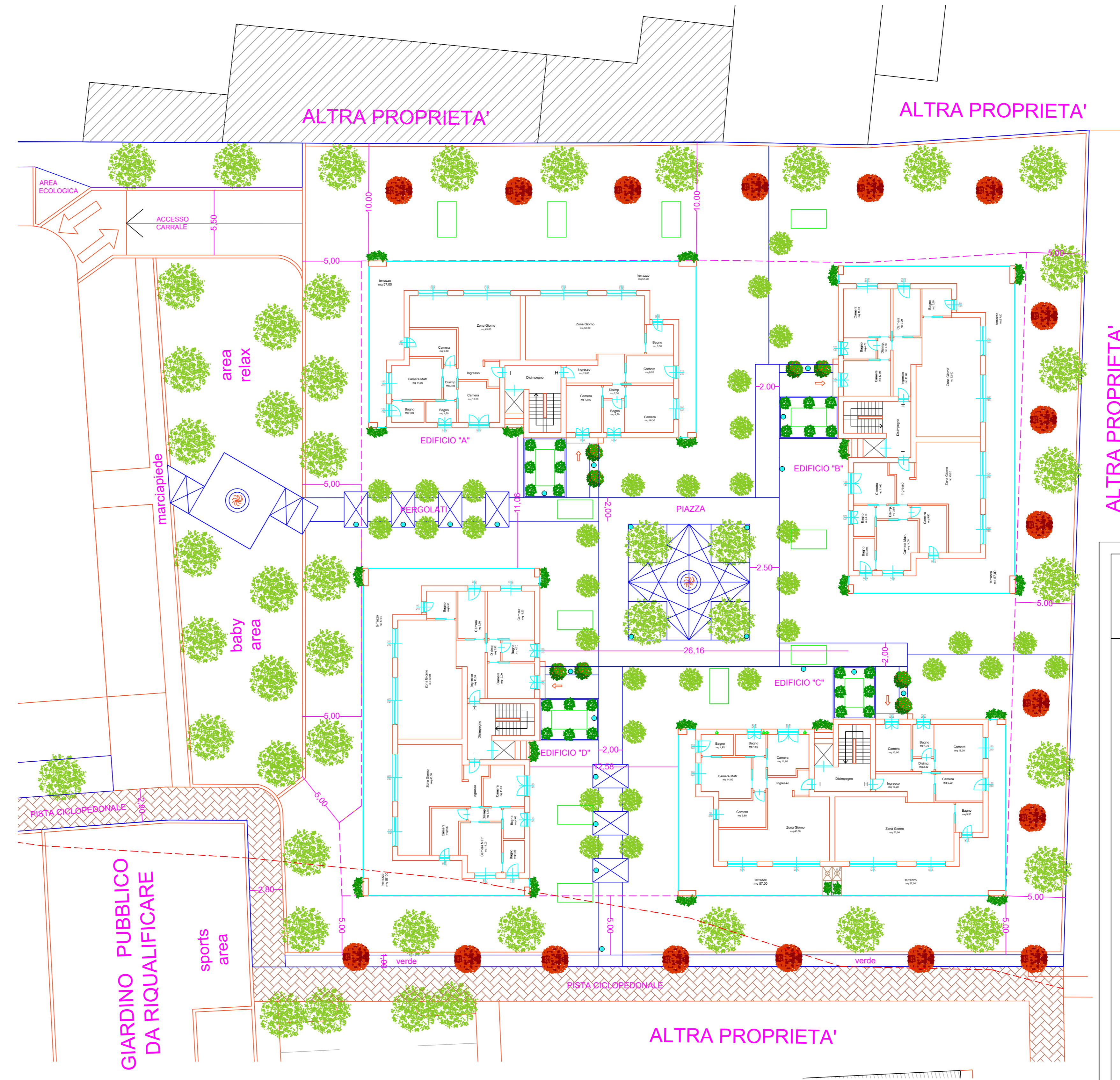
PIANTA PIANO SECONDO