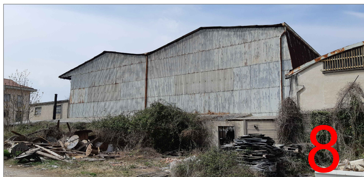
vista capannone da sud