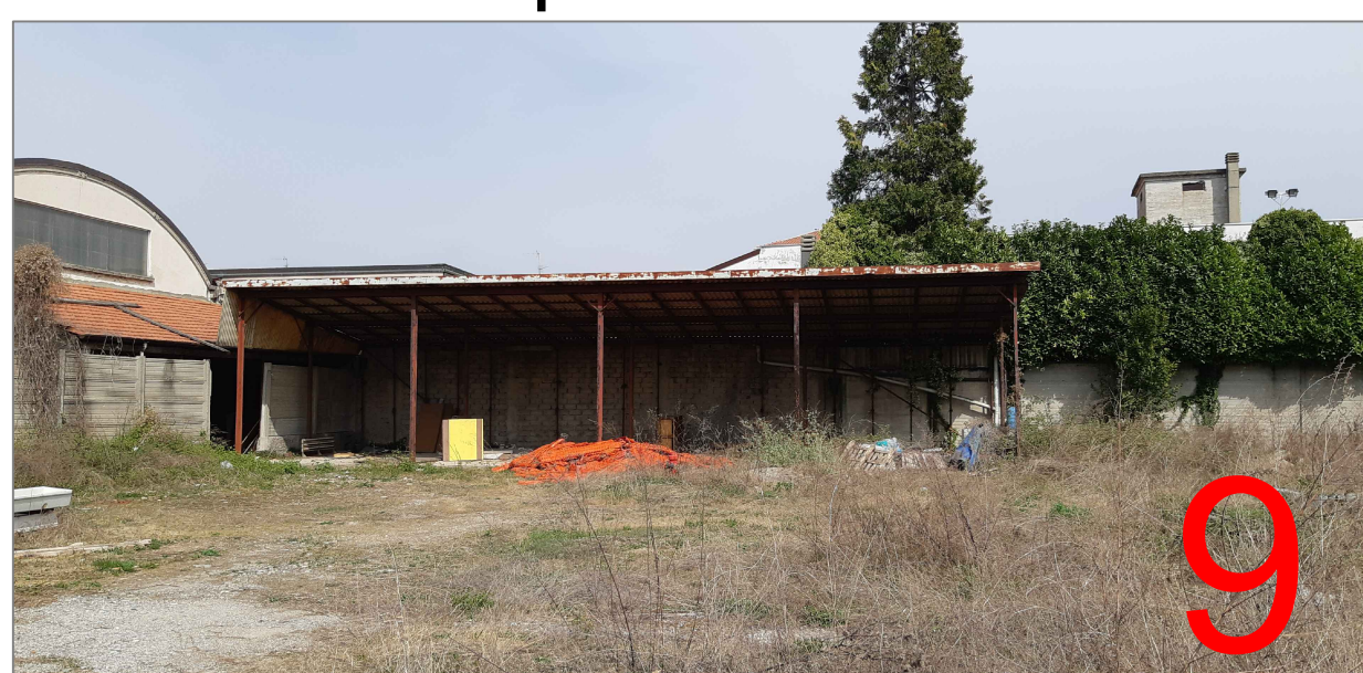
vista tettoie cortile sud