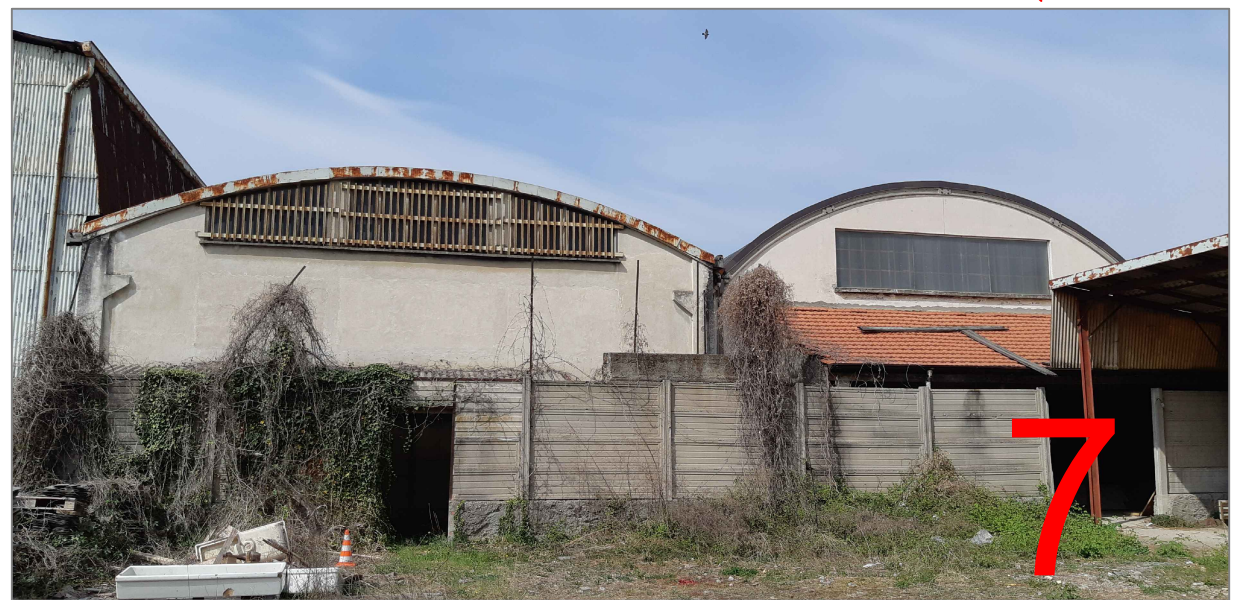
vista capannone da sud