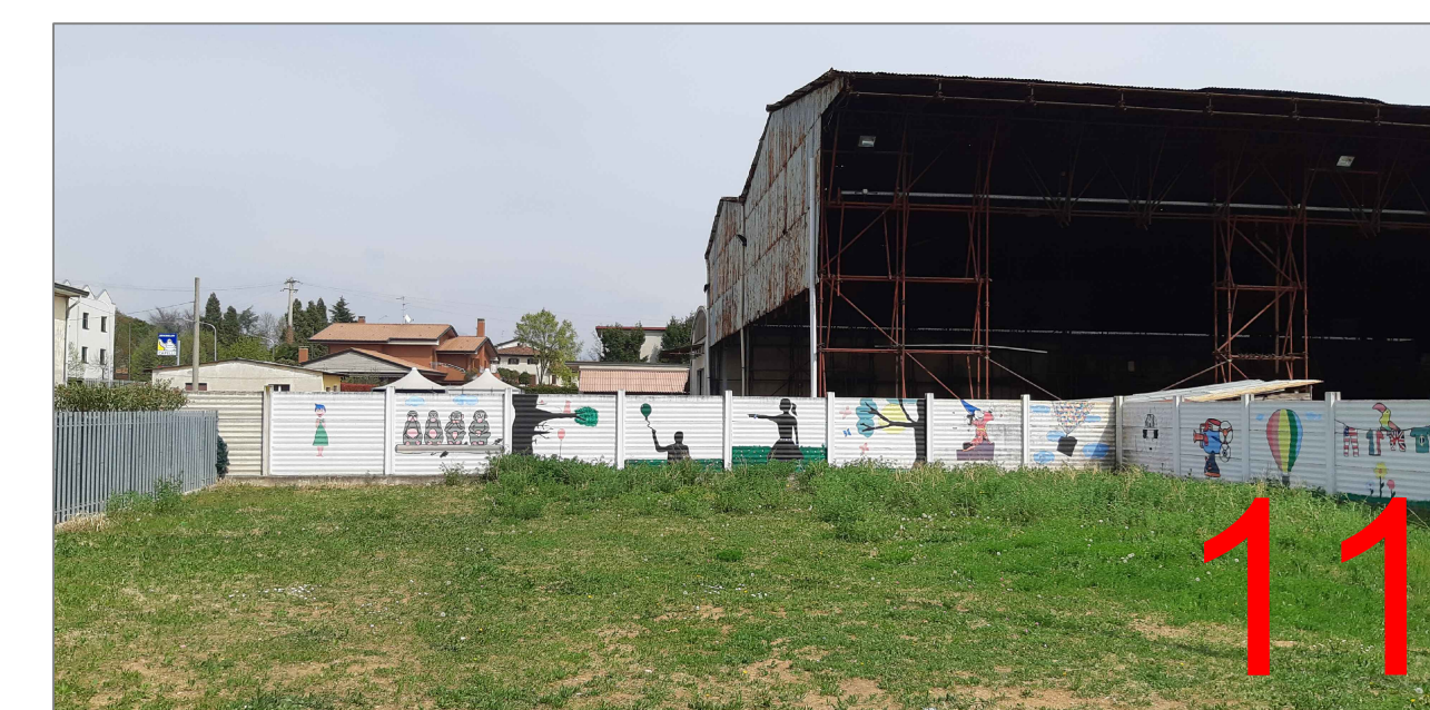
vista da giardinetto pubblico