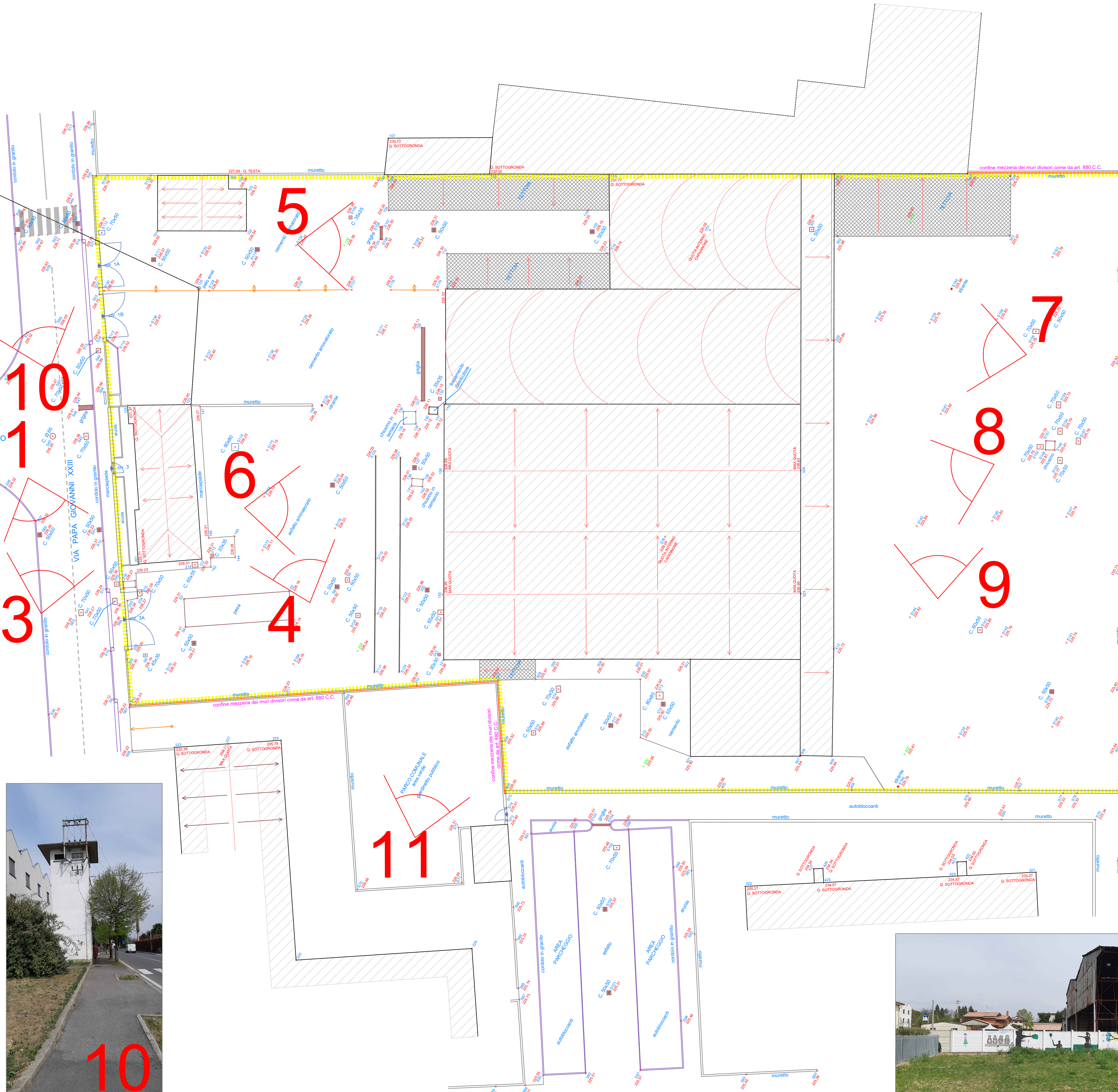
RILIEVO AREA DI INTERVENTO