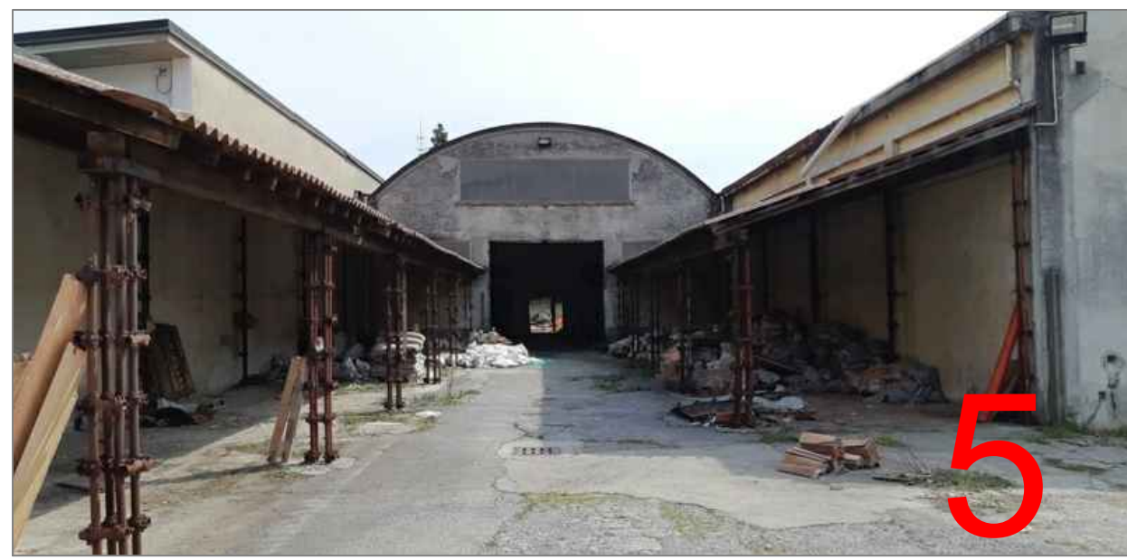
vista tettoie lato est