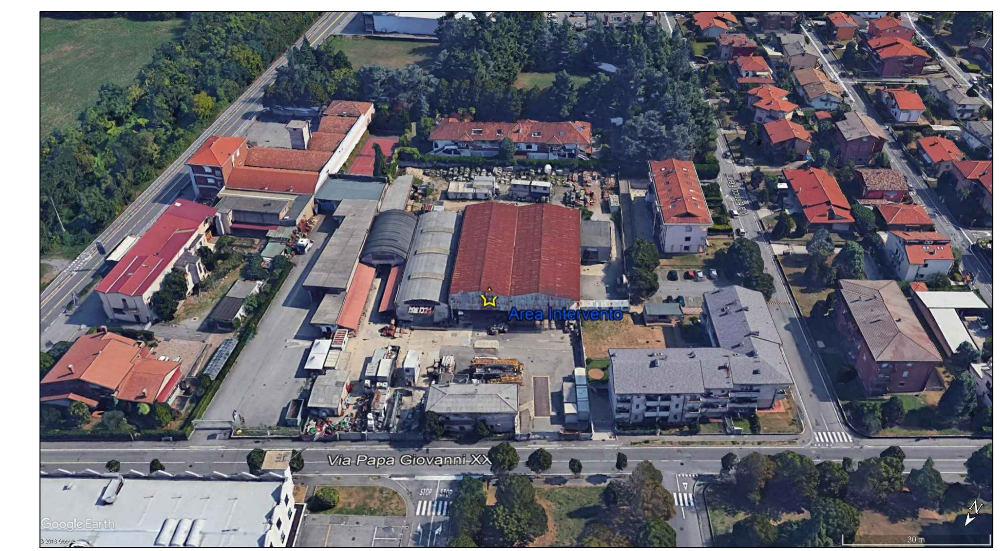
VISTA AEROFOTOGRAMMETRICA DA NORD - VIA PAPA GIOVANNI XXIII