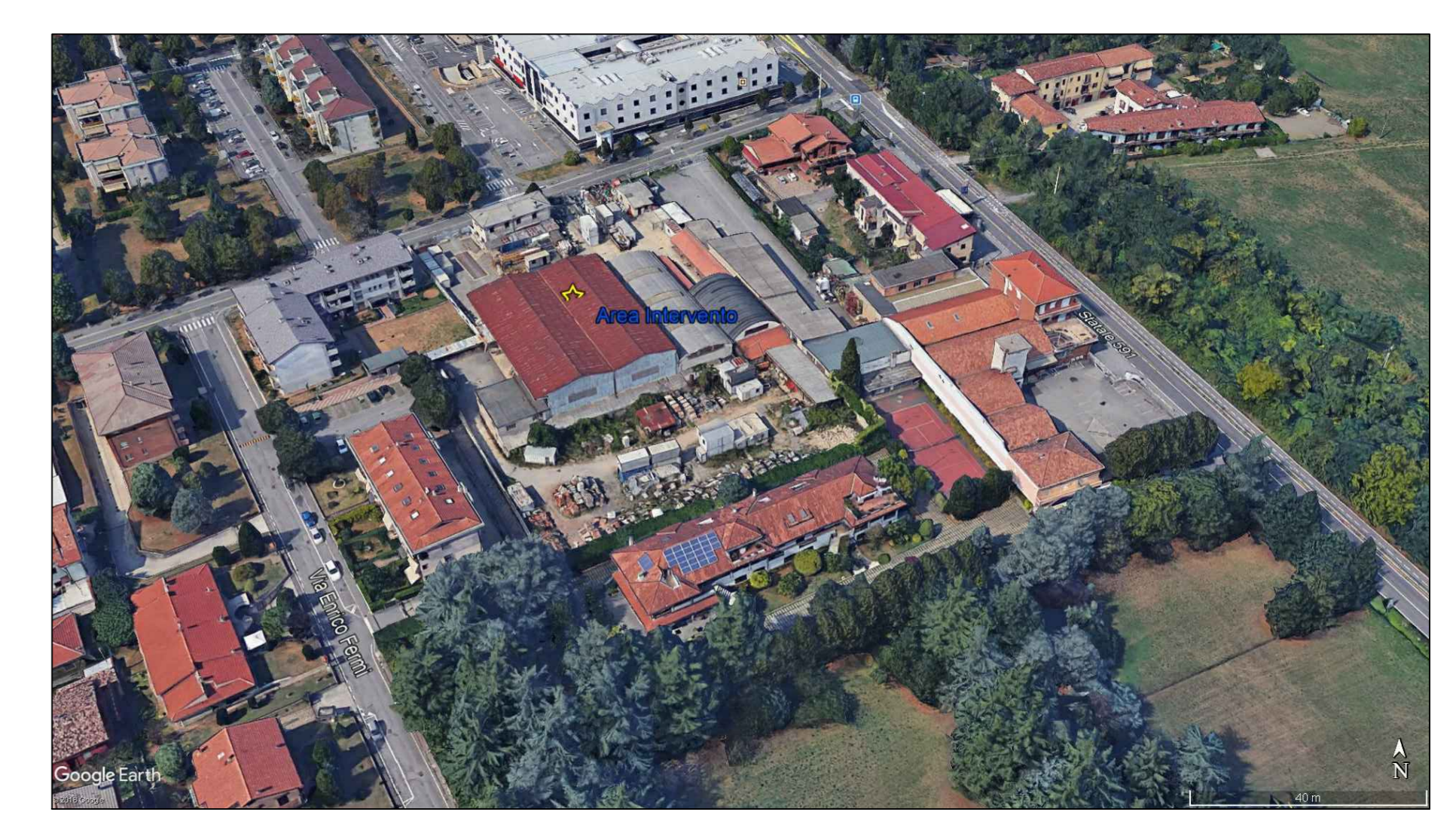
VISTA AEROFOTOGRAMMETRICA DA SUD